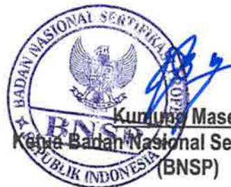
Kurniung Masehat Ketua Badan Nasional Sertifikasi Profesi (BNSP)